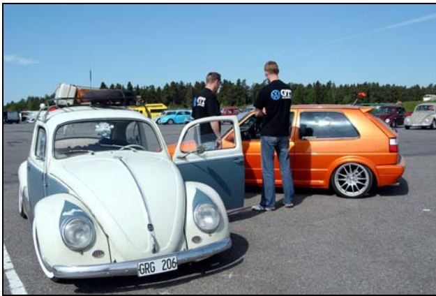
Foto från Bug Run 2006